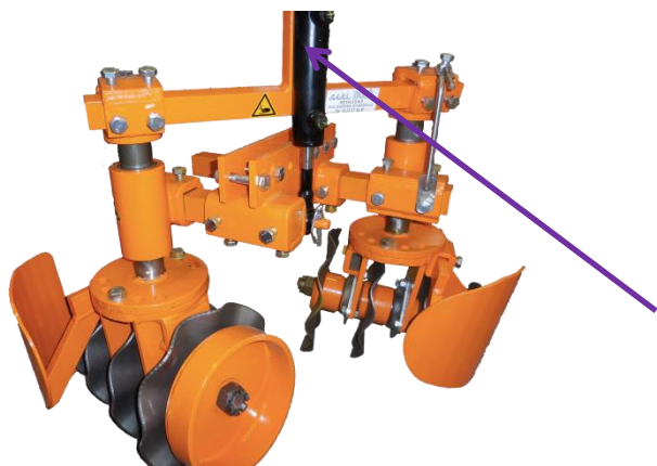
Vue de dessus